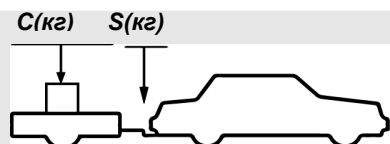
верное размещение груза