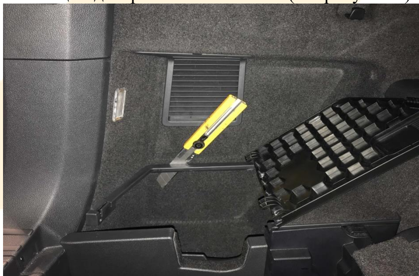
Рисунок - 1