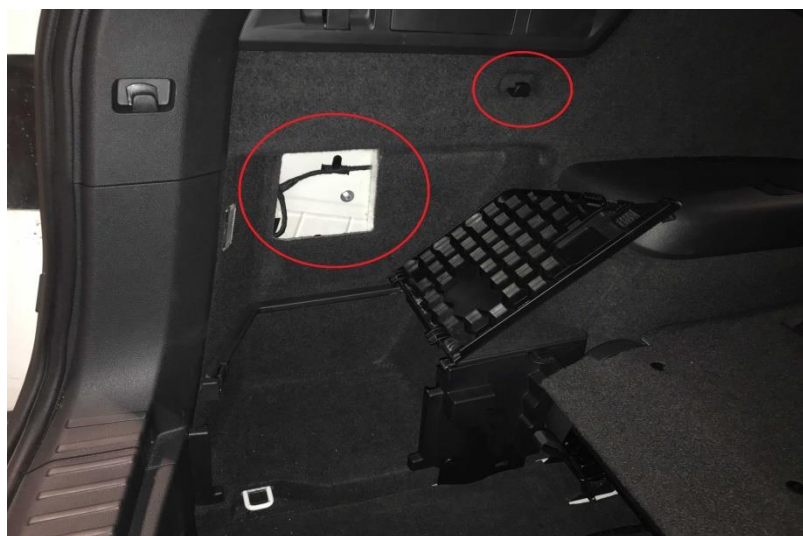
Рисунок - 2