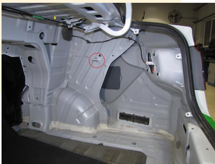
Рисунок – 1