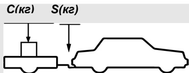
верное размещение груза