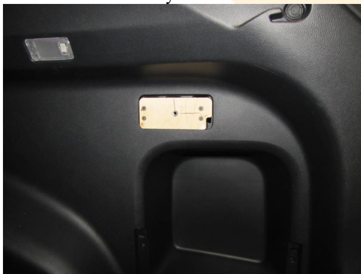
Рисунок – 3

4. Подключаем провода к терминалу в коробе.