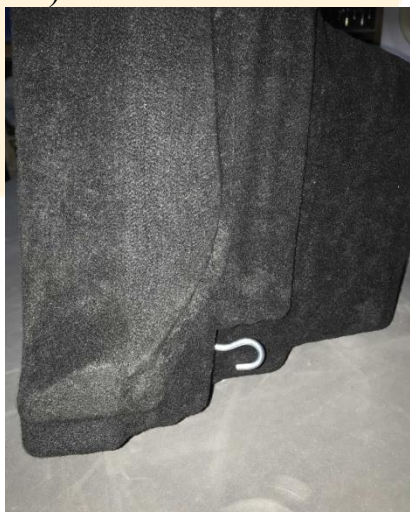
Рисунок - 4

5. Вставляем крючок в короб и фиксируем его в горизонтальном положении (см. рисунок 4).