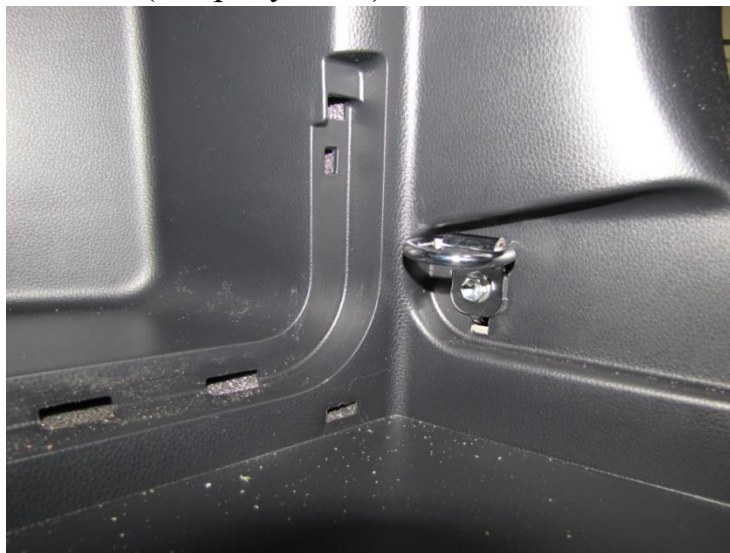
Рисунок - 5

7. Задвигаем короб в нишу, после проворачиваем крючок в вертикальное положение, так чтобы он захватился за кольцо. (см. рисунок 6)