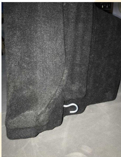
Рисунок - 6

7. Задвигаем короб в нишу, после проворачиваем крючок в вертикальное положение, так чтобы он захватился за кольцо. (см. рисунок 6)