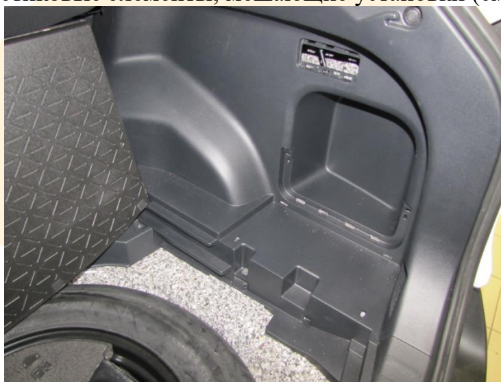
Рисунок – 1