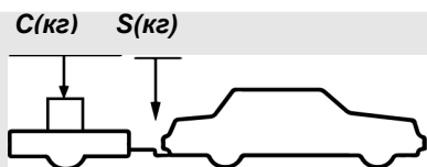
верное размещение груза