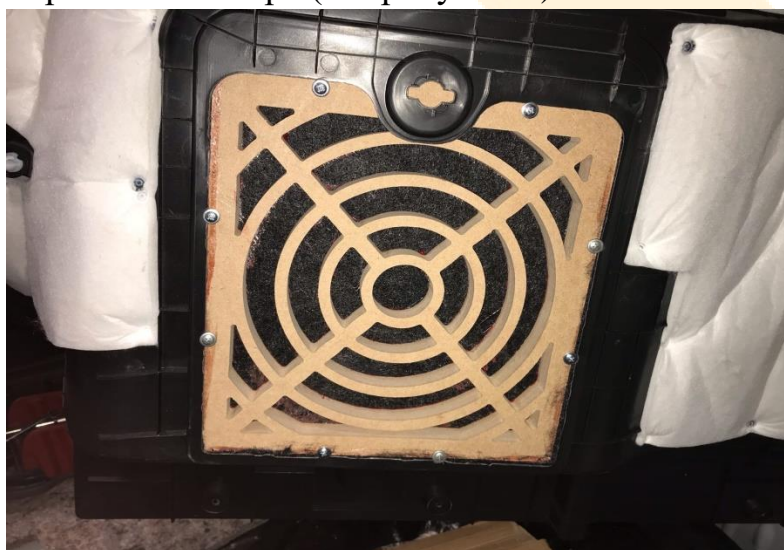
Рисунок - 6

13. Теперь крепим декоративную деталь к заводскому пластику. Снимаем проставку в пластике и на ее место крепим декоративную деталь саморезами с набора (см. рисунок 6).