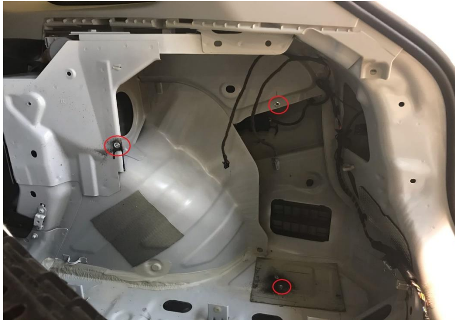
Рисунок - 4