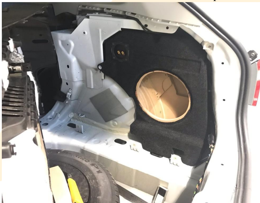
Рисунок - 5