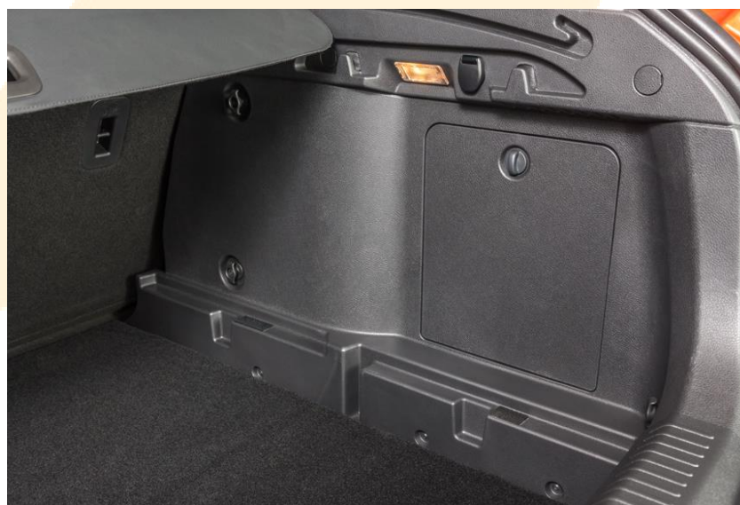
Рисунок - 1