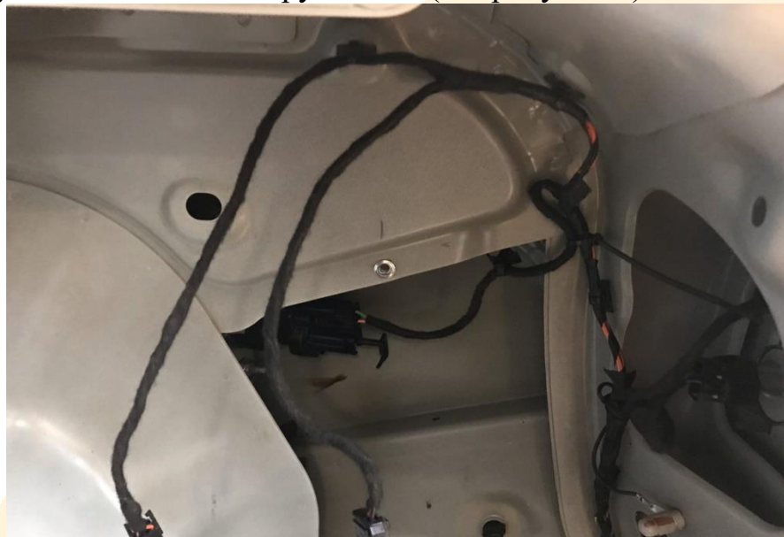
Рисунок - 3