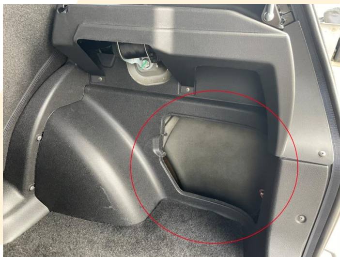
Рисунок – 1