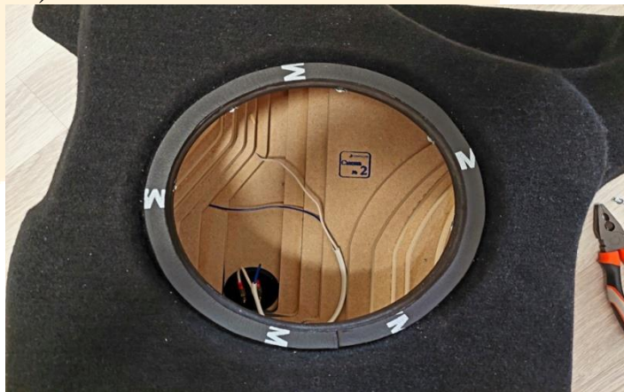
Рисунок – 4