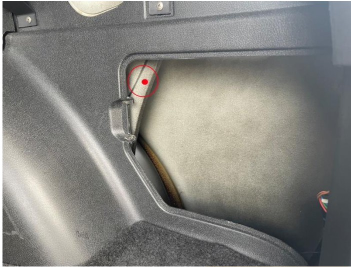
Рисунок - 2